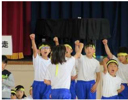
気合いを入れてオー！！