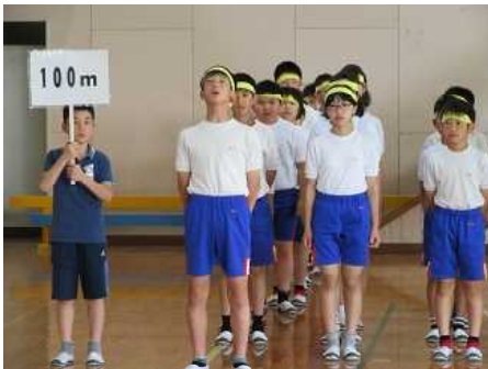
各種目ごとに目標を宣言