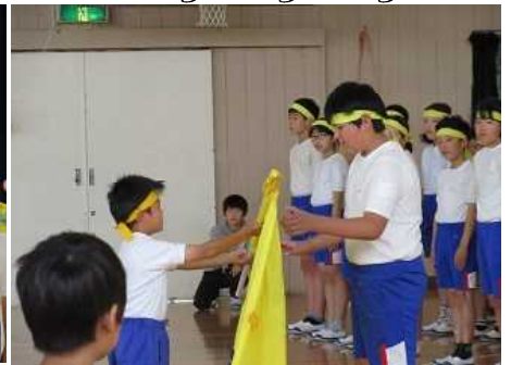
激励の旗が代表児童から選手へ